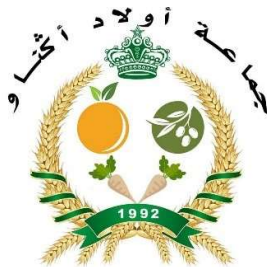
Figure 3 Logo