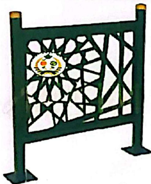
Figure 1 Modèle Garde de corps avec Logo